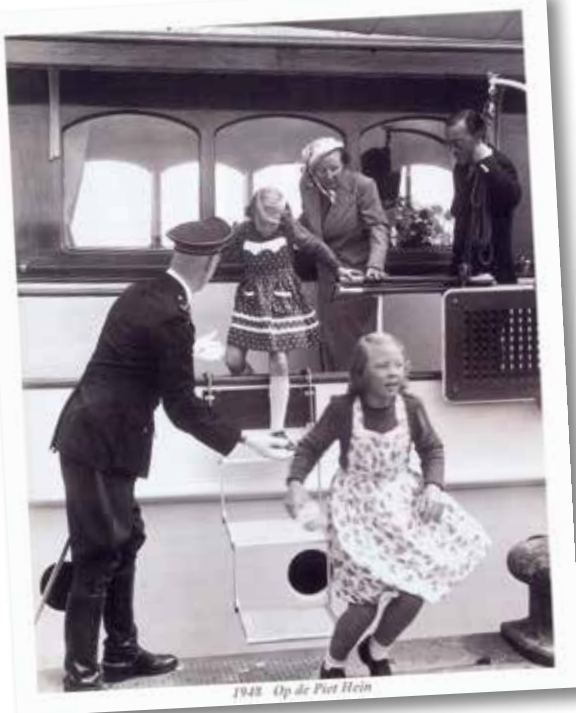
1948 - Op de Piet Hein