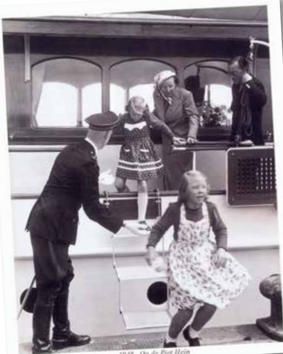
1948 - Op de Piet Hein